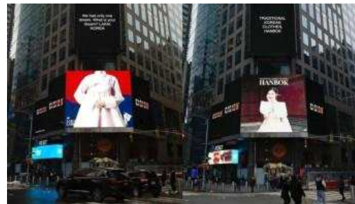
뉴욕 타임스퀘어 한복 홍보