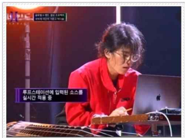
슈퍼밴드 가야금x서양악기 공연