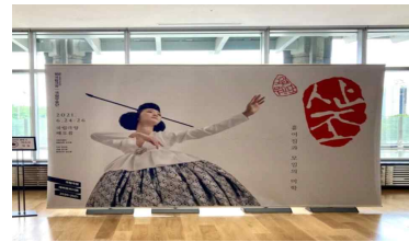
국립무용단 한복의상 공연