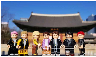
레고 한복 BTS 커스텀