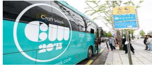
참고: 2018 KCDF 기획투어 <공예버스>