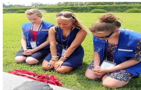
UN 참전용사 국내 초청사업