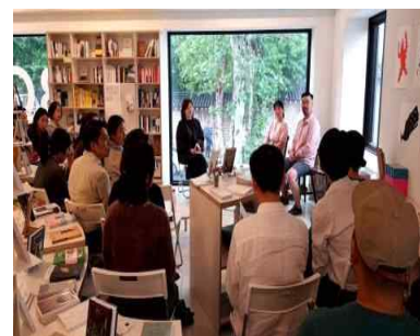
헤드쿼터 운영 및 토크 콘서트 예시