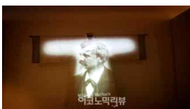
아름지기x벤츠 공예, 한복 등 전시