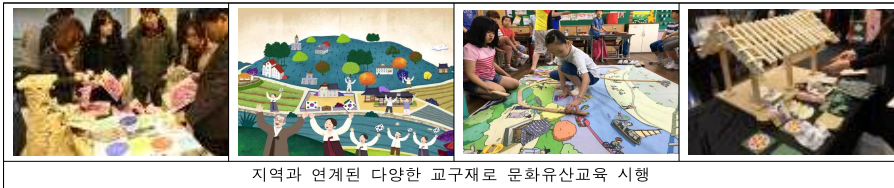
지역과 연계된 다양한 교구재로 문화유산교육 시행