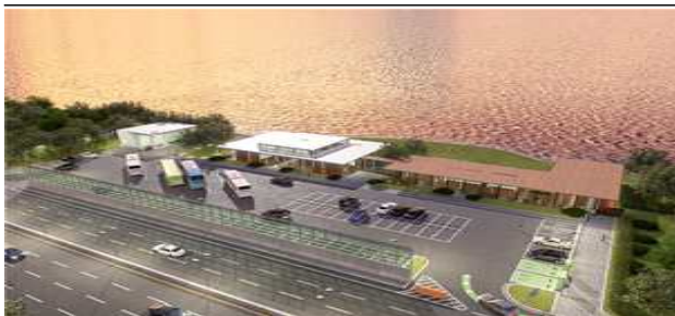
스마트 복합쉼터 조감도(안)