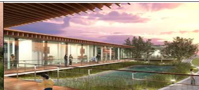
스마트 복합쉼터 내부전경(안)