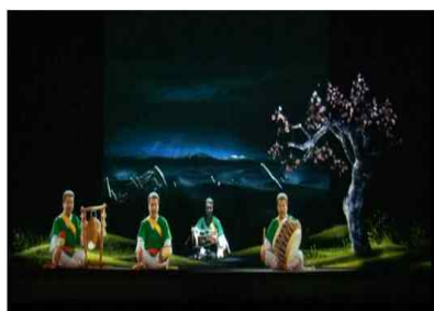
김덕수 풍물 공연(홀로그램) 같은 공간에서 연주하는 모습 재현