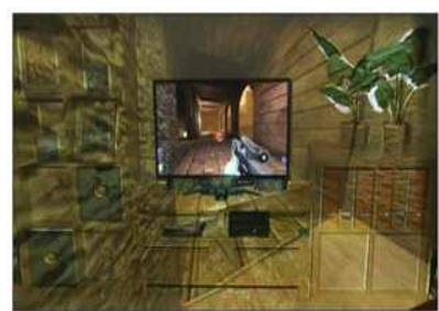
일루미룸(MS, 출시 예정) 화면과 벽 전체를 이용하는 게임 환경