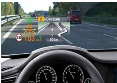
Smart Windshield(BMW, 출시 예정) 각종 메시지를 차 앞 유리에 디스플레이