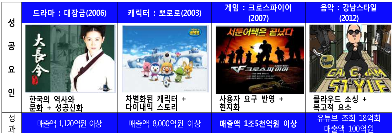
<그림> 콘텐츠 고부가가치 창출 사례