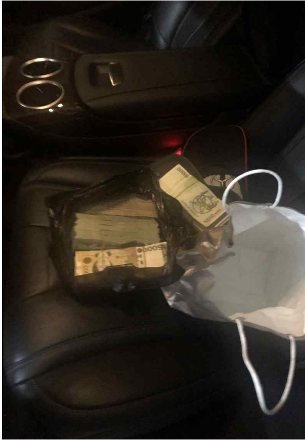
차량 수색 및 범죄수익금 확인