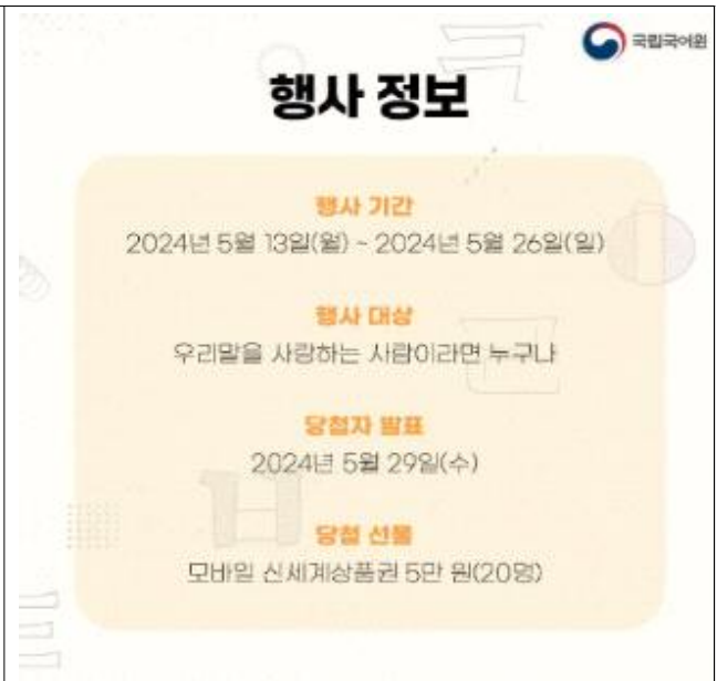
<국립국어원> “슬기로운 우리말 생활 - 도전, 외국어를 바꿔라!” 캠페인 포스터