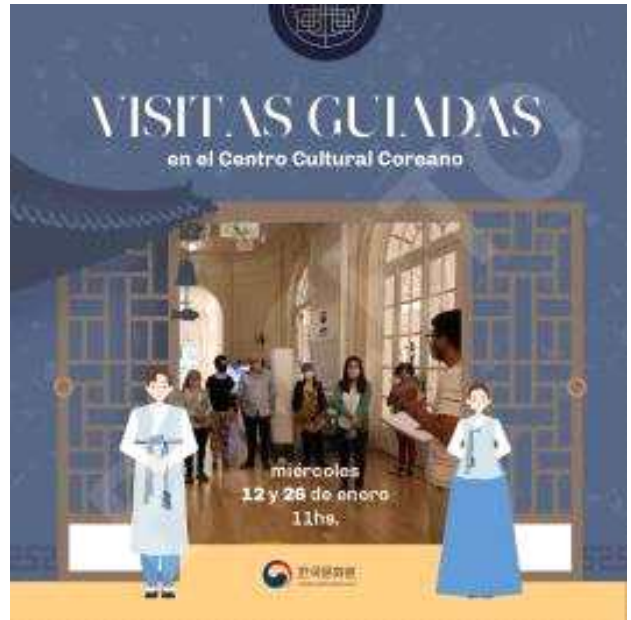
설날 기념 문화원 방문프로그램 (주아르헨티나한국문화원)