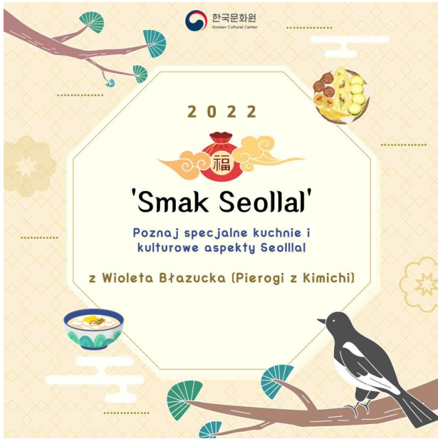
설날 행사 (주폴란드한국문화원)