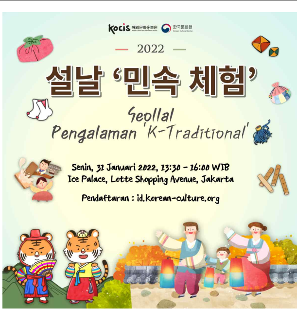
설날 민속체험