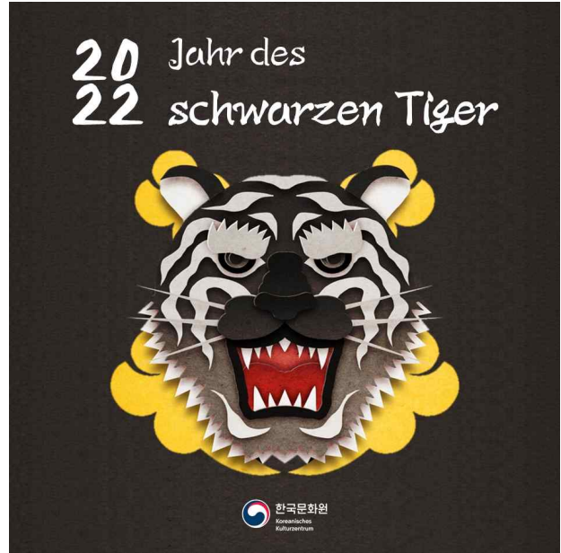
설특집 카드뉴스 흑호의 해 (주독일한국문화원)