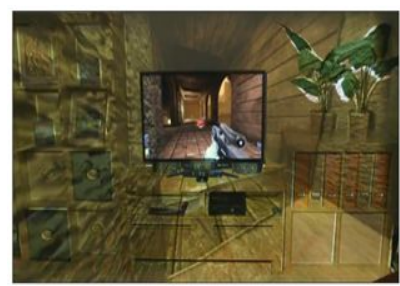
일루미룸(MS, 출시 예정) 화면과 벽 전체를 이용하는 게임 환경