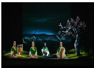
김덕수 풍물 공연(홀로그램) 같은 공간에서 연주하는 모습 재현