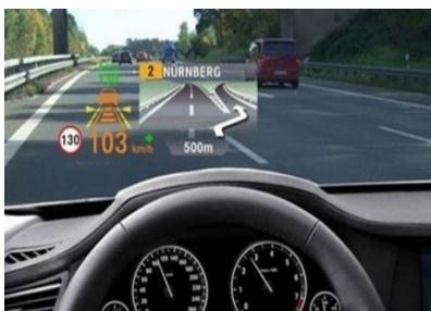
Smart Windshield(BMW, 출시 예정) 각종 메시지를 차 앞 유리에 디스플레이

* (예시) 향후 3년 내 기업·시장에 중요한 영향을 미칠 기술(분야는 추후 결정)