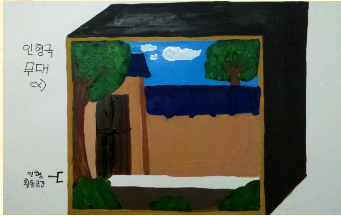
인형극 무대의 예

정몽주의 아버지, 어머니, 정몽주(성장에 맞춰 캐릭터를 따로 제작), 주공, 이성계, 이방원, 여자 하인, 남자하인, 자객, 정몽주의 후손, 일꾼1, 노인.