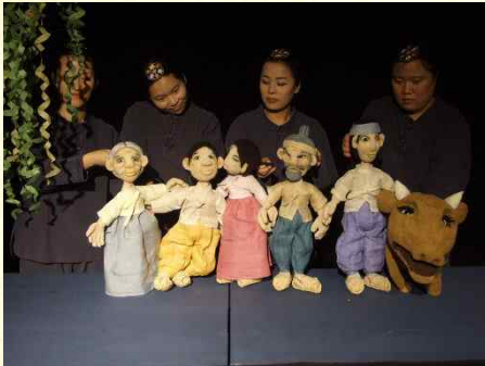
일반적인 인형극의 모습

어린이들을 대상으로 한 종이인형극이다. 일반적인 종이인형연극과는 다르게 어린이들이 직접 참여 활동을 함으로써 포은 문화제의 주인공인 정몽주 선생에 대해 쉽게 이해할 수 있게 한다.